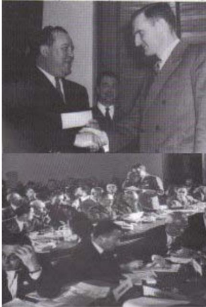
"Nel 1945 i Rockefeller erano pronti", scrisse Allen.

"Il nipote Nelson era uno dei 74 membri del CFR alla riunione fondativa delle Nazioni Unite a San Francisco." Perloff ha aggiunto: "Dei delegati americani alla conferenza fondativa delle Nazioni Unite a San Francisco, più di quaranta appartenevano al CFR."