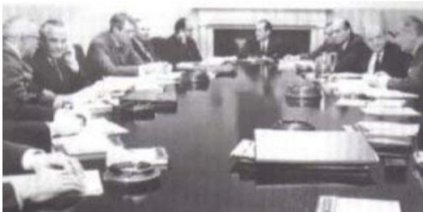
Questa fotografia del 1968 sulla destra mostra Il Presidente Johnson si consulta con i consiglieri in merito ai colloqui di pace per il Vietnam. Tranne Johnson, tutti erano membri del CFR. Da sinistra a destra: Andrew Goodpastor, Averell Harriman, Cyrus Vance, Maxwell Taylor, Walt Rostow, Richard Helms, William Bundy.

Proseguendo, ha affermato, il CFR "esercita un'influenza di controllo sui funzionari governativi che attuano le politiche e, attraverso una propaganda massiccia e abile, influenza il Congresso e l'opinione pubblica affinché sostengano tali politiche". Ha inoltre affermato che "l'obiettivo di questo governo invisibile è quello di convertire l'America in uno stato socialista e poi di farne un'unità in un sistema socialista mondiale".