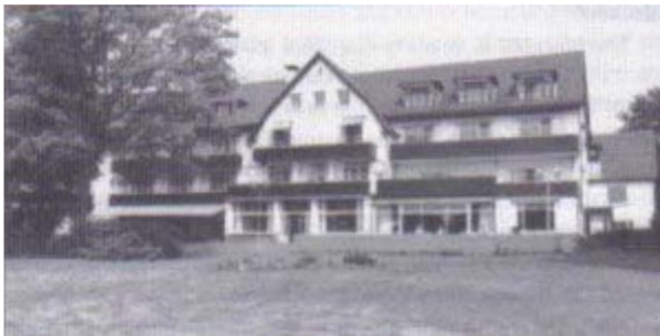
Il primo incontro ufficiale del

I Bilderberg sono un gruppo internazionale composto da esponenti della famiglia reale europea, investitori di Wall Street, politici, banchieri internazionali, importanti uomini d'affari, dirigenti dei media e leader militari provenienti da tutto il mondo. "Tra i presenti figurano importanti personalità politiche e finanziarie degli Stati Uniti e dell'Europa occidentale", ha proclamato Allen. Allen afferma inoltre che probabilmente "non è un caso" che meno di una persona su 5.000 sia a conoscenza di questo gruppo. Jim Marrs ha scritto: "I Bilderberg sono un gruppo di uomini e donne potenti, molti dei quali appartenenti alla famiglia reale europea, che si incontrano in segreto ogni anno per discutere le questioni del giorno".