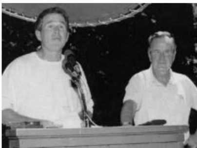
Sulla sinistra vediamo sia George HW che George W.