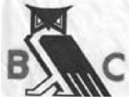
"Il gufo di Boemia" è il simbolo del club.

Si dice che alcuni membri abbiano le loro case piene di gufi. "I membri del club collezionano statuette, statuette, gioielli a forma di gufo, qualsiasi cosa che abbia un gufo sopra", ha dichiarato Hanson. Ha poi aggiunto: "Li vedrete camminare per il Grove indossando polo ricamate con gufi, fibbie per cinture a forma di gufo, piastrelle a forma di gufo, gemelli a forma di gufo, anelli a forma di gufo... Il gufo si trova su tutti i materiali bohémien, dalle bustine di fiammiferi agli zerbini, fino alle più elaborate pubblicazioni del Club". A quanto pare, tutta questa merce può essere acquistata presso il negozio di souvenir del Bohemian Grove. I singoli campi sono decorati con statuette di gufi in legno o pietra, secondo Weiss. Persino il servizio navetta 24 ore su 24 all'interno del Grove si chiama "The Owl Shuttle". Nella foto a destra, vediamo il gufo su un tovagliolo preso da una sala da pranzo.